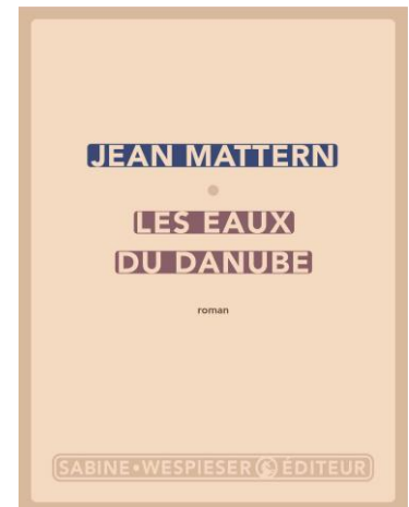
Sabine Wespieser Éditeur – février 2024

Orpheline, Rose est devenue mère à 16 ans et a quitté sa Corse natale pour rejoindre Toulon, une décision de son mari persuadé qu'ils y trouveront une vie meilleure.