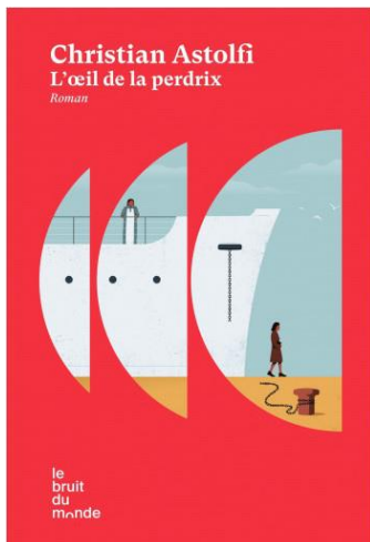
Éditions Le bruit du monde – août 2024